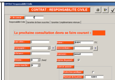
(Exemple d'un formulaire d'un contrat responsabilité civile)